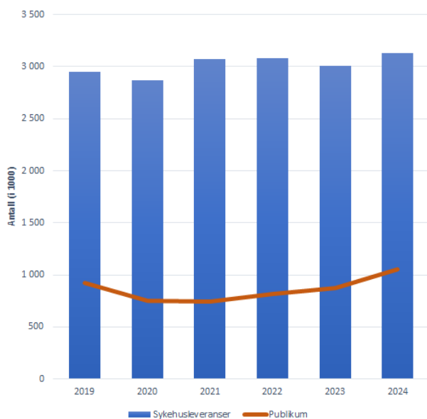
Grafikk 3; Antall ekspedisjoner og leverte pakninger i perioden 2019 til 2024

Sammenlignet med 2023, økte den totale omsetning i 2024 for Sykehusapotekene HF med 10%. Omsetningsveksten henger i stor grad sammen med overtagelse av sykehusapotekene på Lovisenberg og Diakonhjemmet i tillegg til at 2024 var første hele år med aktivitet på Aker.